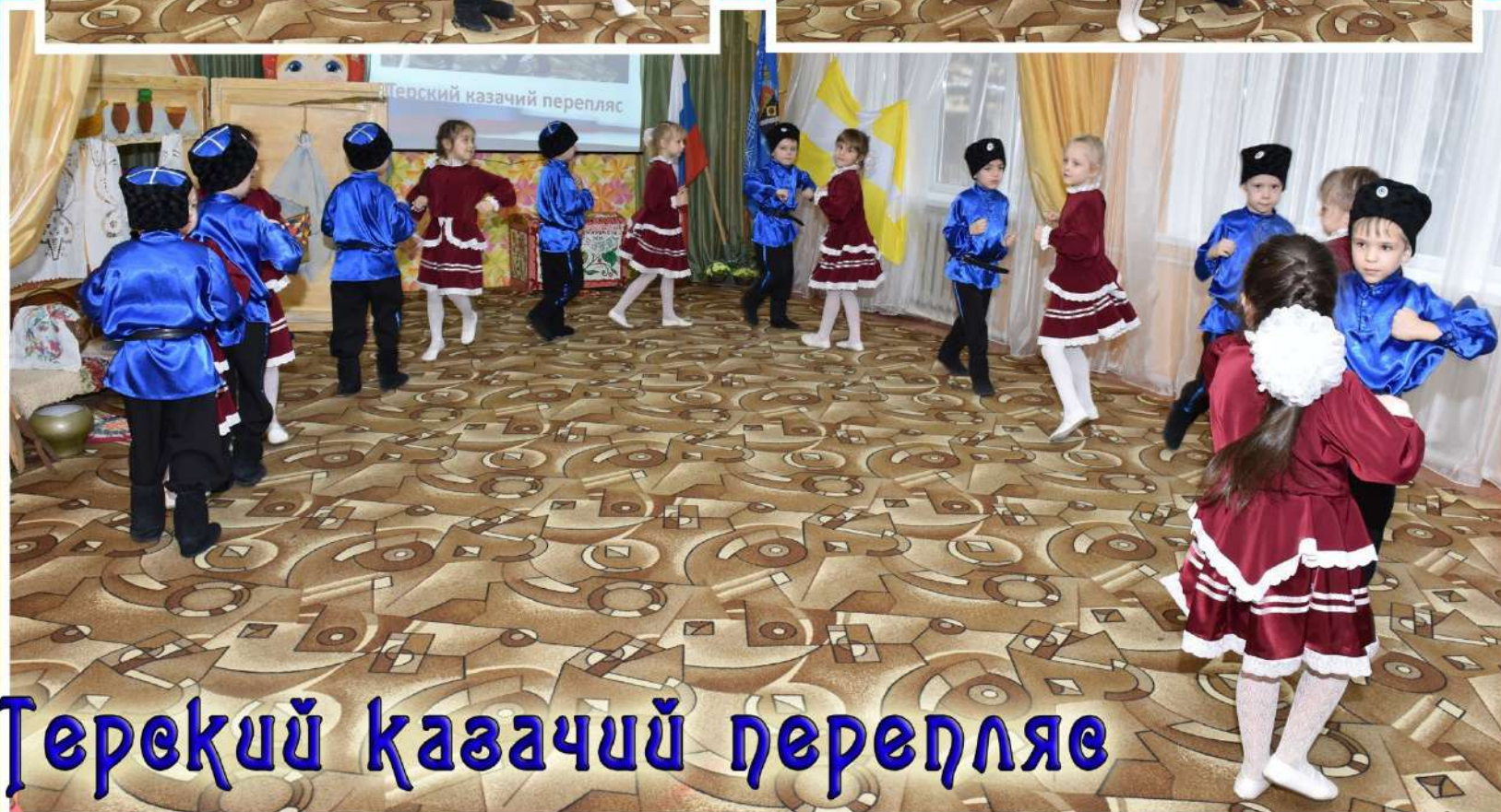
Терекский казачий перепляс