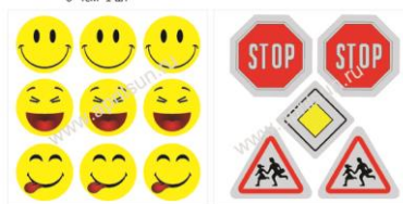
Набор наклеек "Улыбка" 9 элементов 3*3 см*9 шт