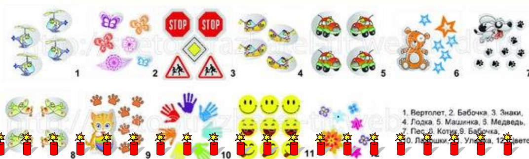
1. Вертолет, 2. Бабочка, 3. Знаки, 4. Лодка, 5. Машинка, 6. Медведь, 7. Пес, 8. Котик, 9. Бабочка, 10. Ладочки, 11. Улыбка, 12. Цветок