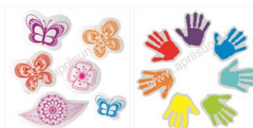
Набор наклеек "Бабочка" 6 элементов в наборе Размеры: 3*3см*3 шт и 2*2 см* 1 шт 6*4см*1 шт